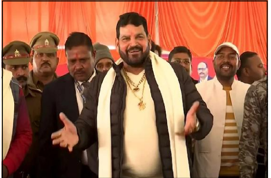
भारतीय कुश्ती महासंघ के पूर्व अध्यक्ष और भाजपा सांसद बृजभूषण शरण सिंह ने गृहमंत्री अमित शाह