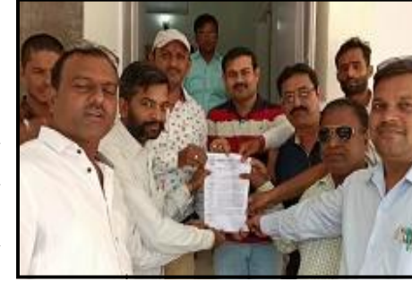
अवध की आवाज ब्यूरो