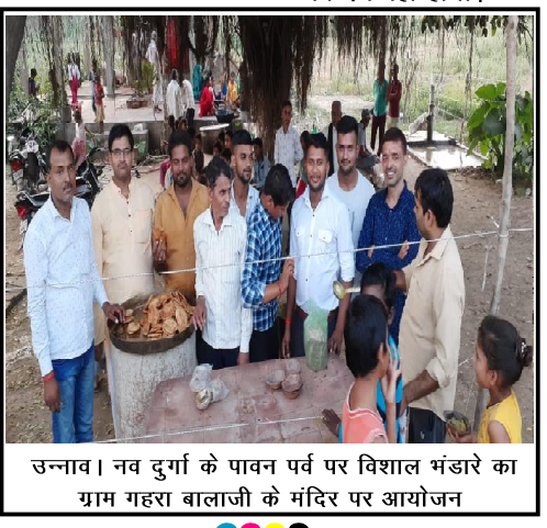
उन्नाव। नव दुर्गा के पावन पर्व पर विशाल भंडारे का ग्राम गहरा बालाजी के मंदिर पर आयोजन