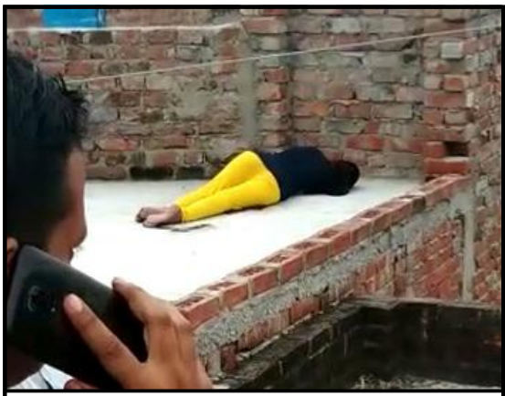
अवध की आवाज ब्यूरो सीतापुर। 11हजार हाईटेंशन लाइन की चपेट में आने से 14 वर्षीय किशोरी की हुई मौत, किशोरी छत पर गई थी किसी काम से, छत पर निकली 11 हजार हाईटेंशन की लाइन की चपेट में आने से किशोरी की हुई मौत, जब तक परिजन पहुंचे छत पर तब तक किशोरी की हो चुकी थी मौत, थाना मिश्रिख इलाके के मोहल्ला रन्नुपर वार्ड का मामला है।