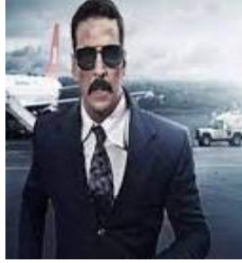
यह पहली ऐसी फिल्म है जिसे सिनेमाघरों में रिलीज की गई है। फिल्म को दर्शकों और फिल्म क्रिटिक काफी अच्छे रिव्यूस भी मिल रहा है। हालांकि अब यह फिल्म एक मुसीबत में धिरेली नजर आ रही है। बीते दिन पंजाब के किसान पटियाला के थिएटर के बाहर फिल्म बेल बॉटम के रिलीज का विरोध करते नजर आए। साथ

मुंबई, (वेब वार्ता)। अक्षय कुमार की मोस्ट अवैटेड फिल्म 'बेल बॉटम' पिछले हफ्ते रिलीज कर दी गई। कोरोनावायरस महामारी के बाद