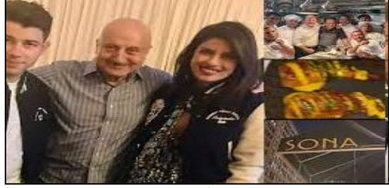
रेस्ट्रॉन्ट SON की शुरुआत की है, जो मॉडर्न इंडियन खाने के रेस्ट्रॉन्ट अंदाज और डिफरेंट वरायटीज को लेकर फेमस है। यहां इंडियन खाने की अलग-अलग शानदार वरायटी का