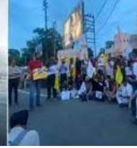
तिवारी ने किया है। इस फिल्म में खिलाड़ी कुमार अक्षय एक रॉ एजेंट की भूमिका में नजर आ रहे हैं। फिल्म में आदिल हुसैन, वाणी कपूर, हुमा कुरैशी और लारा दत्ता भी मुख्य भूमिकाओं में हैं। पंजाब के किसान पिछले साल सितंबर

ही थिएटर के बाहर अक्षय कुमार की फिल्म देखने वालों शर्म करो के नारे भी लगाए गए। गौरतलब है कि फिल्म का निर्देशन रंजीत