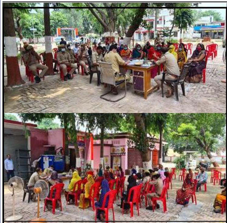
अवध की आवाज ब्यूरो

दने वाला पहला राज्य बन गया है। उन्होंने कहा कि यदि सदन के सदस्य कोरोना वायरस की जांच और संक्रमण से निपटने संबंधी प्रयासों पर सहयोग करेंगे, तो अफवाह फैलाने वाले तत्व बेनकाब होंगे। उन्होंने निःशुल्क टीका उपलब्ध कराने के लिये प्रधानमंत्री का आभार व्यक्त किया। उत्तर प्रदेश विधानसभा का मानसून सत्र मंगलवार से शुरू हो रहा है, जो 24 अगस्त तक चलेगा।